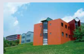
観光庁長官登録旅行業第1967号